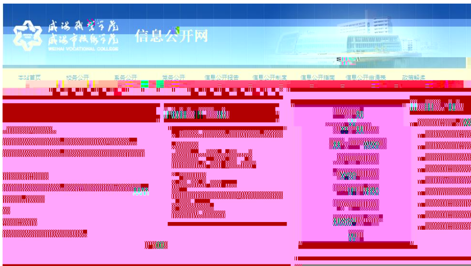
(威海职业学院信息公开网)